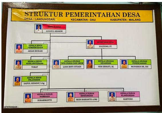
Gambar 4. Struktur Organisasi Kepemrintahan Desa Landungsari

Untuk menyelenggarakan segala urusan dan kebutuhan Desa, Desa Landungsari memiliki seperangkat kepengurusan desa yang membantu merealisasikannya. Berikut Struktur Organisasi Landungsari pada gambar berikut ini: