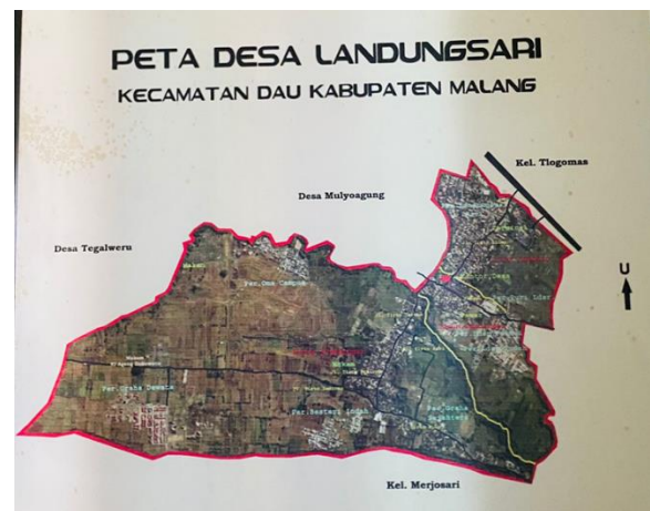
Gambar 3. Peta Desa Landungsari